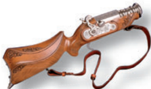
BH09MAX LUXUS VERSION