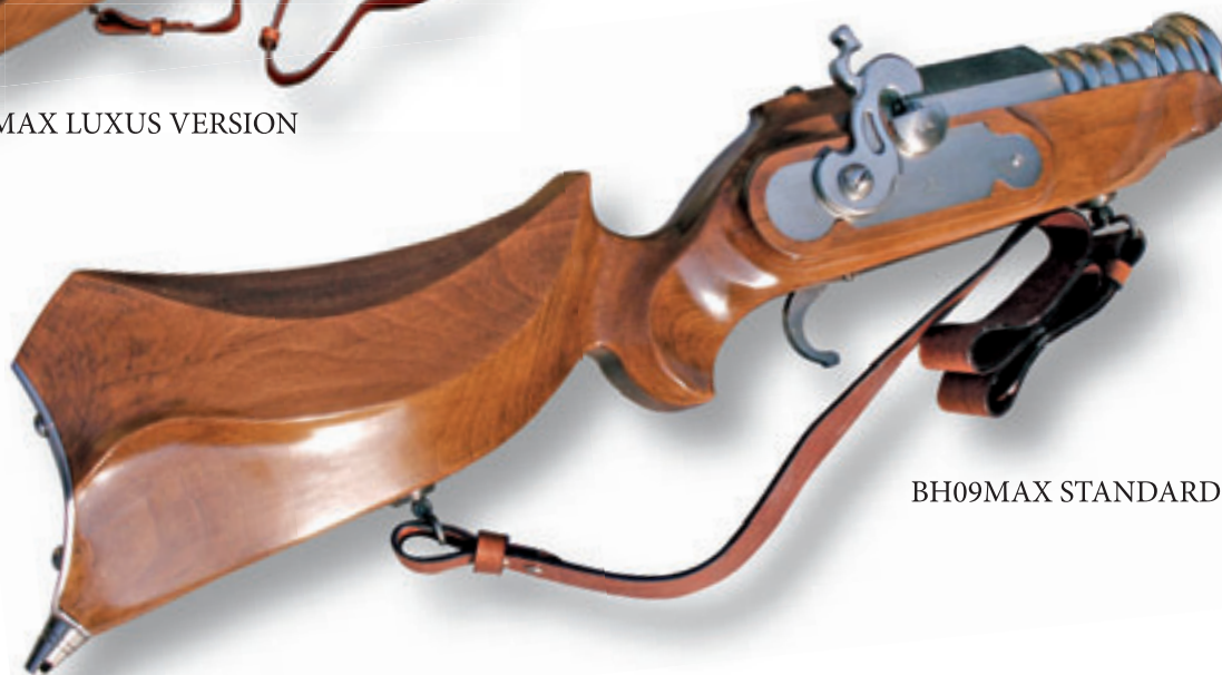
BH09MAX STANDARD VERSION

Arma di origine tedesca (bavarese) riproposta in versione a percussione. Adatta per manifestazioni ed intrattenimenti folcloristici riproduce la versione originale databile 1820-1835.